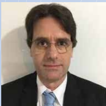
Dra. Álvaro Piazze Hospital Pasteur. Montevideo, Uruguay